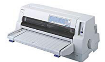
ドットインパクトプリンタ

ご存知のように、ドットインパクトプリンタの印刷時の音はまさに騒音です。電話しているときは、相手の声が聞こえなくなるほどです。また、プリンタの設置には印刷用紙を格納するプリンタ台が必要です。プリンタ台を置く場所の確保が必要になります。