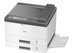
レーザープリンタ